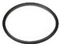
EM-Storr 110L 大型真空サンプル容器用交換用 NBR O リング、 内径 Ø115mm x 5mm CS