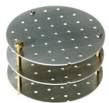
EM-Tec PS87 13-001055-EL 用穴あきシェルフ、容量 87 ピン スタブ、 Ø109mm、高さ 3 x 25mm