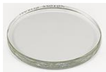
EM-Storr 110L 大型真空サンプル容器用交換用強化ガラス蓋、Ø130 x 10.2m