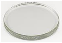
EM-Storr シリーズ 80 真空サンプル容器用交換用強化ガラス蓋、Ø100x10mm